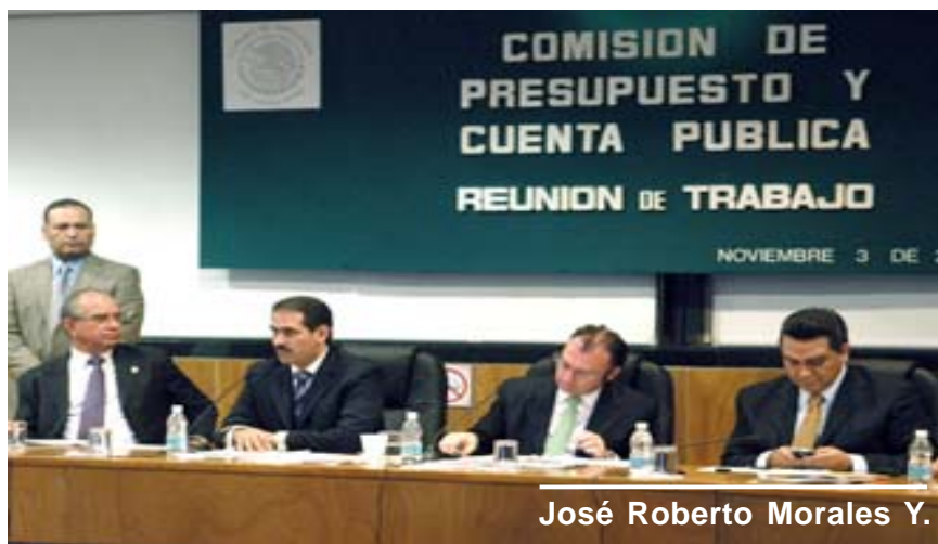
José Roberto Morales Y.

A l presentar ante los integrantes de la Comisión de Presupuesto y Cuenta Pública de la Cámara de Diputados su propuesta sobre el «Presupuesto de Egresos de la Federación 2010 para Sonora», el gobernador Guillermo Padrés Elías les informó que las propuestas y necesidades han sido consensadas entre los alcaldes, diputados locales y los sonorenses, pero se busca reforzarlas y enriquecerlas con las sugerencias que puedan surgir de la Cámara de Diputados de aquí al día 15 de noviembre, fecha propuesta para la aprobación del Presupuesto de Egresos (PEF) para el próximo año.